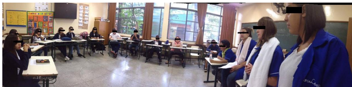
Figura 1: Alunos e monitores durante a explicação e realização da dinâmica de leitura.

Após a realização da prática, que foi realizada em dois encontros, foi possível observar resultados envolvendo a questão da leitura, do conhecimento científico dos alunos e da criatividade envolvida na produção das naves. No total, a atividade contou com a participação de dez alunos. A dinâmica de leitura se mostrou interessante, pois, diferente de uma leitura silenciosa, a roda de leitura, aparentemente, fez com que todos lessem e ficassem atentos ao texto para não perder ou errar sua vez. Além do mais, foi uma atividade que permitiu identificar o nível e as dificuldades de leitura de alguns alunos.